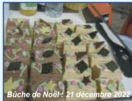
Bûche de Noël : 21 décembre 2022

Les aînés du CLUB de l'ÉTANG très touchés, remercient les enfants de leurs beaux dessins et leur souhaitent une bonne année scolaire.