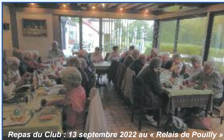
Repas du Club : 13 septembre 2022 au « Relais de Pouilly »

NOUS VOUS ATTENDONS TOUTES ET TOUS POUR LE REPAS DANSANT À LA SALLE DES FÊTES DE MESVES LE DIMANCHE 12 FÉVRIER 2023