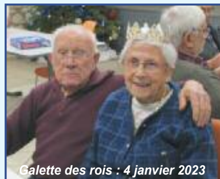
Galette des rois : 4 janvier 2023

Le 4 e trimestre 2022 s'est déroulé pour le club normalement avec nos après-midis de loisirs habituels. Le 13 septembre nous nous sommes réunis autour de la table du Relais de Pouilly pour le repas annuel toujours très apprécié de nous tous, journée chaleureuse et amicale.